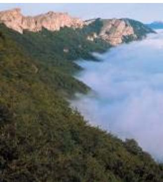
Las Sierra de Urbasa y Andía, barrera natural entre la zona atlántica y la mediterránea.

El Parque Natural de Urbasa y Andía se sitúa al oeste de Navarra. Las sierras que lo forman, Urbasa y Andía, son una barrera geográfica de montañas medias entre dos grandes zonas bioclimáticas: la atlántica y la mediterránea.