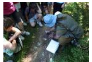
CiN de Roncal . Escolares en una actividad de identificación de huellas de oso

948 475 317 oit.roncal@navarra.es www.cinderoncal.es