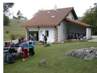
CI de l Parque Natural de Urbasa y Andia.