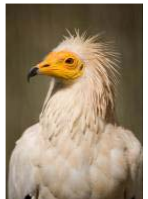
CiN de Roncal . Alimoche