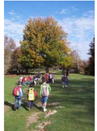
Escolares visitando el Parque Natural de Urbasa y Andía

Aconsejamos concertar las visitas, ya que así podemos garantizar un buen aprovechamiento educativo.