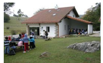
CI del Parque Natural de Urbasa y Andía.