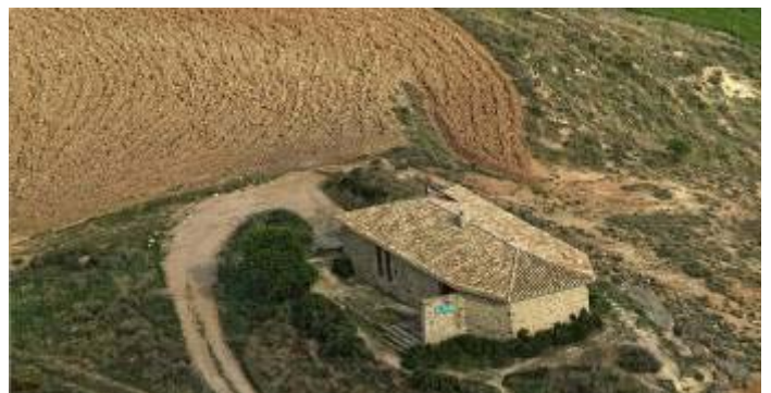
El Bordón: Observatorio de Aves de la Laguna de las Cañas.

Los Observatorios de Aves son infraestructuras de atención al público y educación ambiental situadas en las cercanías de humedales protegidos.