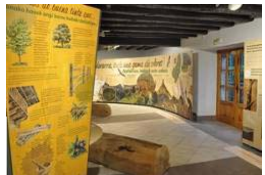
Parque de Bertiz. Planta baja del Centro de Interpretación

En agosto de 2008 se abrió al público el Centro de Interpretación de la Naturaleza totalmente renovado. Se presenta como un equipamiento que pretende informar y orientar al visitante en su visita a Bertiz, ofreciendo un mejor conocimiento y disfrute de los valores naturales y culturales de los que dispone.