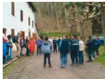
Escolares de visita en el Parque de Bertiz

Aconsejamos concertar vuestra visita con antelación; de este modo podemos garantizar un buen aprovechamiento educativo de la misma.