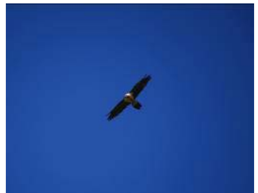
CIN de Ochagavía. Quebrantahuesos en vuelo.

bargo, a través de una senda que discurre junto al barranco podemos adentrarnos en su interior donde podemos observar la especial mezcla de especies de su bosque -hayas y carrascas-. 3, Km. y 65 metros de desnivel son las características del recorrido .