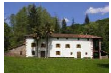
Parque de Bertiz. Refugio Juvenil Casa Zabala

Este programa va dirigido exclusivamente a los grupos escolares con edades comprendidas entre los 3 y los 8 años que visiten el Refugio Juvenil Casa Zabala.