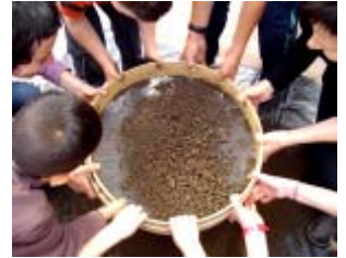
CiN de Ochagavía. Actividad de recogida de semillas