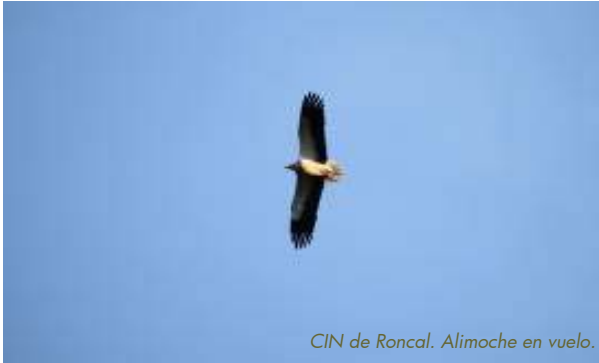
CIN de Roncal. Alimoche en vuelo.

El equipo del CIN de Roncal propone 3 rutas para acercarnos a las aves carroñeras y especialmente al alimoche, descubriendo su hábitat natural, sus características y comportamiento.