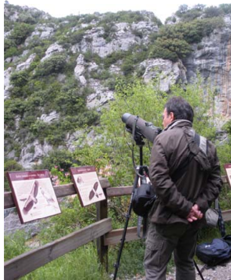
CIN de Lumbier Observador de Aves.

Los Centros de Interpretación de las Foces, Roncal y Ochagavía participan en el proyecto Interreg VULTOURIS, formando una red de equipamientos dedicados a los buitres pirenaicos con otros centros de Aragón y el Valle de Ossau (Francia).