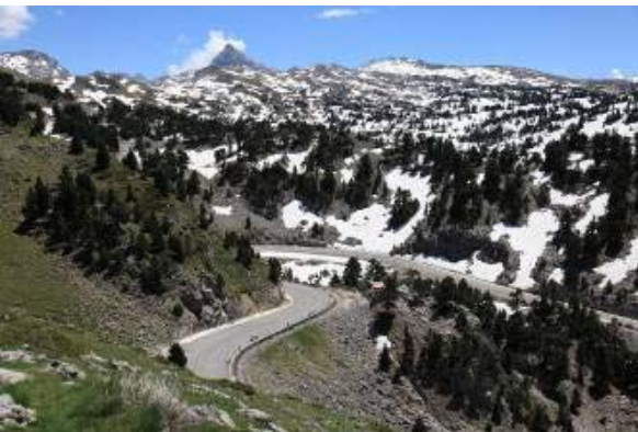
CIN de Roncal. Larra.

El CIN de Roncal ofrece un nuevo paseo exterior por los caminos tradicionales de Larra, uno de los parajes más espectaculares de Navarra. En este recorrido se plantea un juego de descubrimiento de los elementos de este sistema alpino: las distintas formas del relieve kárstico los pastos de montaña y su fauna y flora asociadas, los pinares de pino negro,